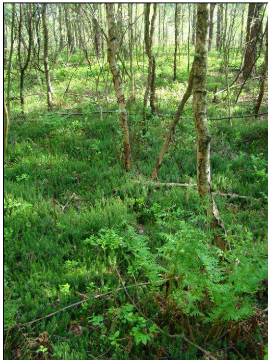
Fot. 8. „Torfowiska Czernik” – nowy obszar Natura 2000 przekazany do Komisji Europejskiej znajdujący się w km 232+550 – 232+770 – siedlisko 91D0-2 bór bagienny z płatem rośliny chronionej widłaka jałowcowatego Lycopodium annotinum