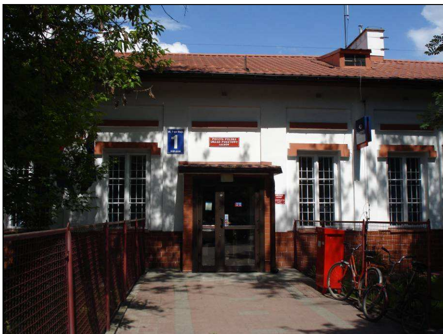
Fot. 4. Budynek poczty w miejscowości Łochów