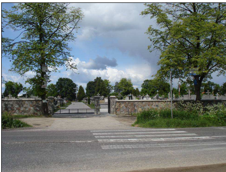
Fot. 6. Cmentarz w miejscowości Łochów zlokalizowany w km 254+400 – 254+600 bezpośrednio przy DK 50