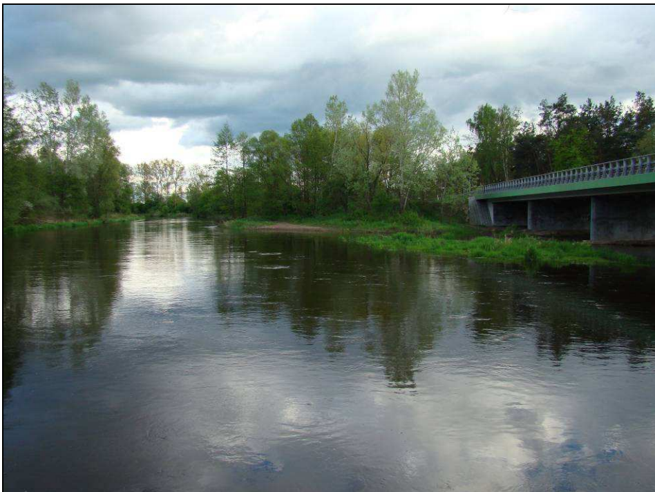
Fot. 10. Przejście inwestycji przez rzekę Liwiec - istniejący obszar Natura 2000 „Dolina Liwca” oraz nowy, przekazany do Komisji Europejskiej obszar „Ostoja Nadliwiecka”