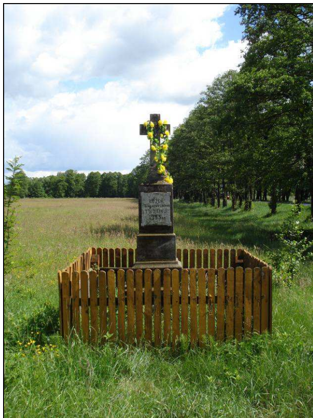
Fot. 3. Krzyż przydrożny zlokalizowany w 244+150 km DK 50