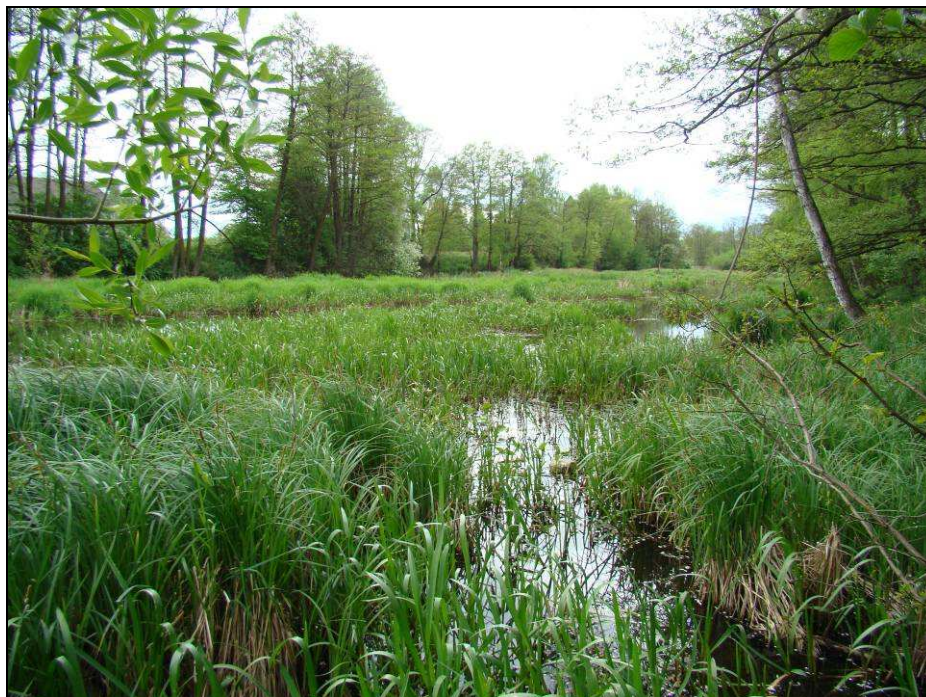
Fot. 11. Dolina rzeki Rządza znajdująca się w 229+810 km