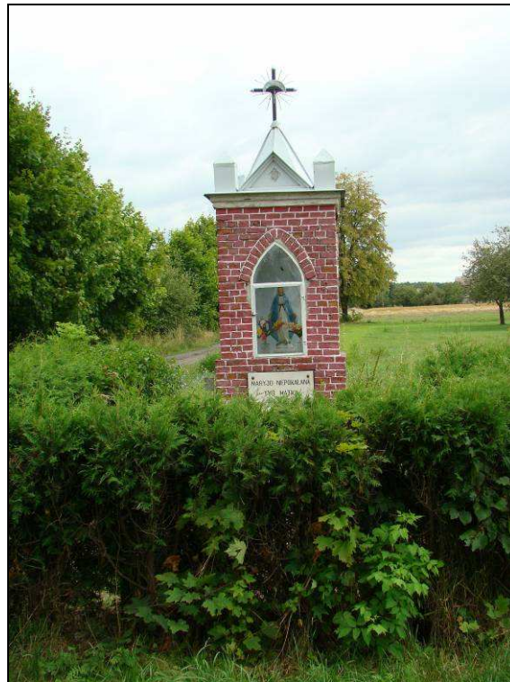
Fot. 2. Kapliczka w Lubominiu zlokalizowana w 224+240 km DK 50