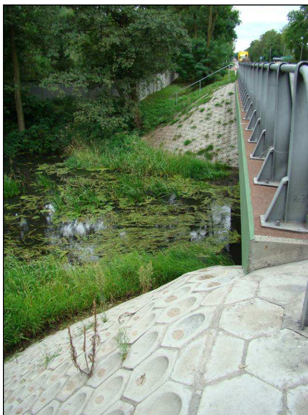
Fot. 12. Most na rzece Rządza znajdujący się w 229+810 km Stanowiska rośliny chronionej - grążela żółtego Nuphar luteum