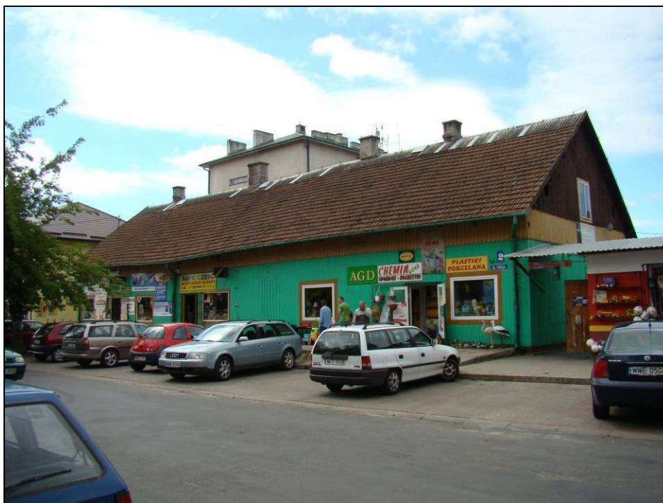
Fot. 5. Dom drewniany z początku XX wieku w miejscowości Łochów