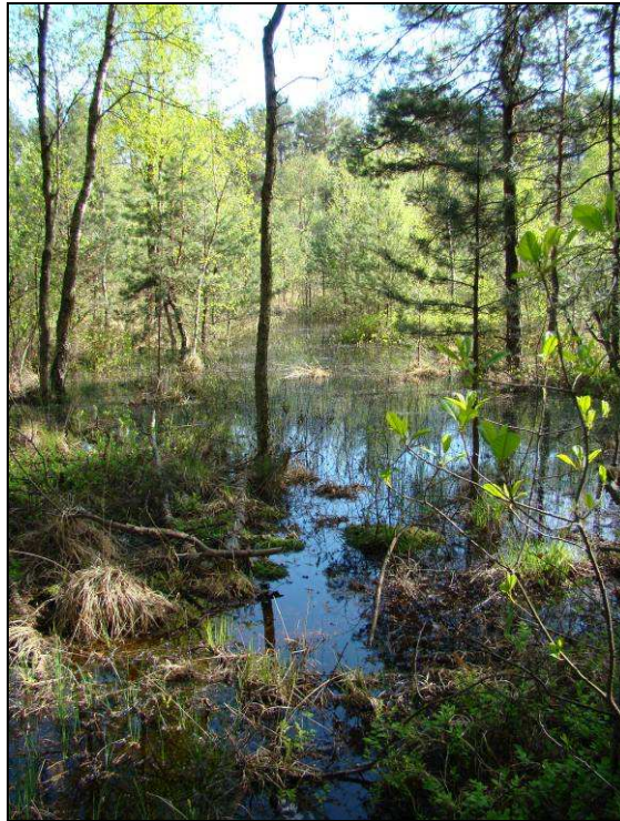
Fot. 7. „Torfowiska Czernik” – nowy obszar Natura 2000 przekazany do Komisji Europejskiej znajdujący się w km 232+550 – 232+770 – siedlisko 7140 torfowisko przejściowe