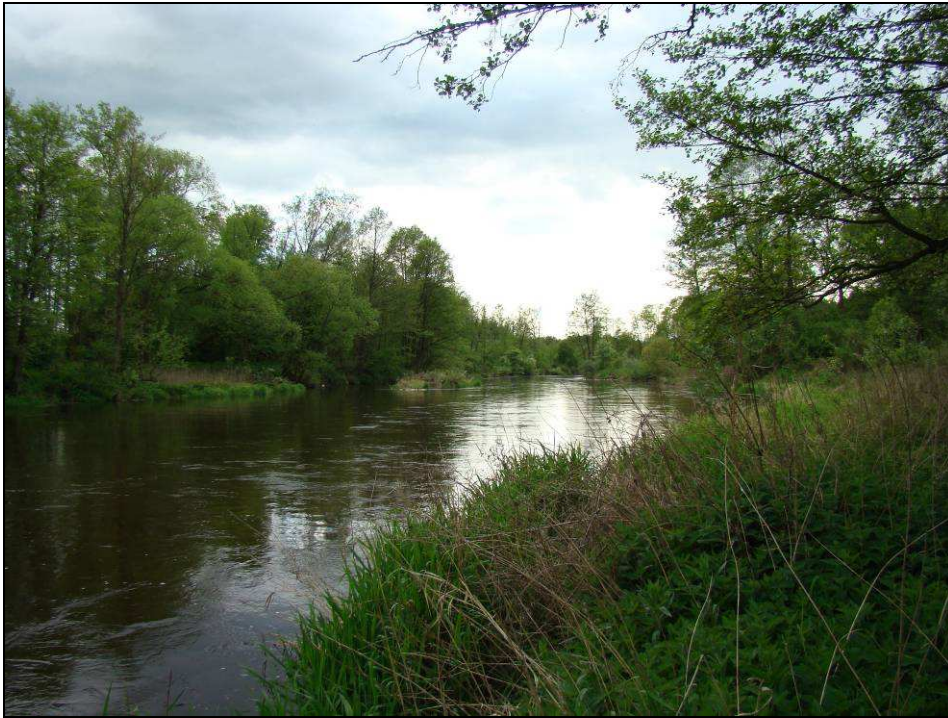
Fot. 9. Rzeka Liwiec - istniejący obszar Natura 2000 „Dolina Liwca” oraz nowy, przekazany do Komisji Europejskiej obszar „Ostoja Nadliwiecka”